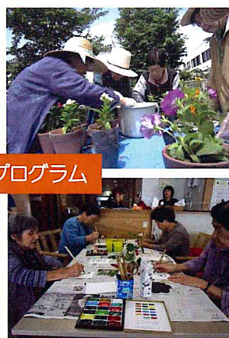
多彩なプログラム