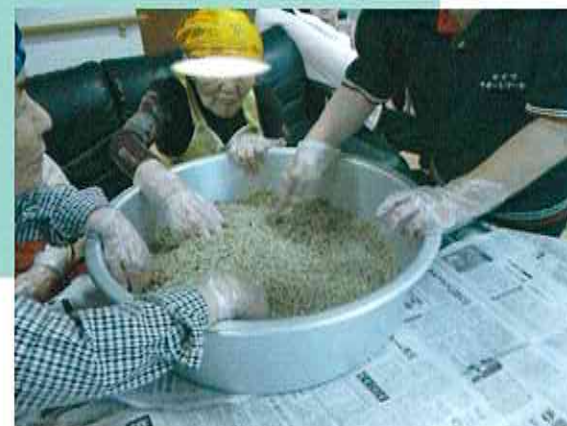
味噌づくりはお手の物

今までされてきた 暮らしを続けられる 安全な環境で、 「ほっ♡」とでき、 くつろいでお過ごし頂ける 支援を心がけています