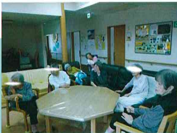
一家団欒のような時間