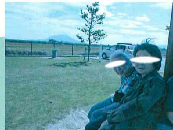
時には遠出で気分転換