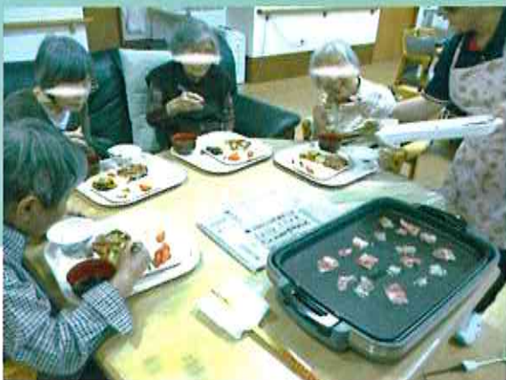
みんなで誕生をお祝い

今までされてきた 暮らしを続けられる 安全な環境で、 「ほっ♡」とでき、 くつろいでお過ごし頂ける 支援を心がけています