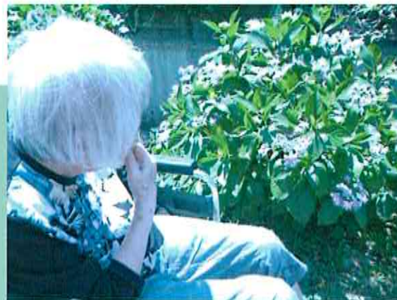
地域を散歩し季節を感じ